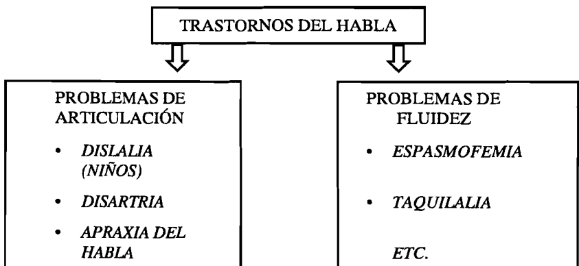
CUADRO N° 1

En cada una de las áreas de trastornos antes mencionadas, existen dife-rentes cuadros. Así, someramente, los trastornos del “habla” pueden clasificarse como se aprecia en el cuadro N° 1.